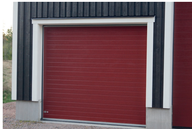
1928 I RÖD VERSION