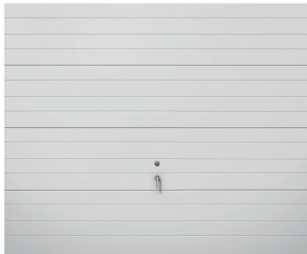
1928 SOM STANDARD (VIT MED HANDTAG)

Alla modeller och aktuella priser hittar du på webben.